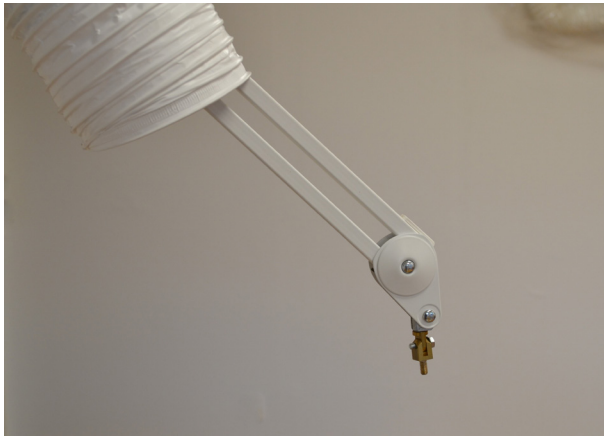
1) Træk slangen op af armen

Her vises trin for trin, hvorledes man monterer sugehovedet: