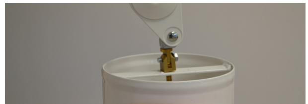
2) Placerer sugehovedet i kardanledet