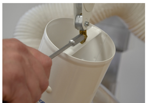
4) Stram møtrikkerne i siderne